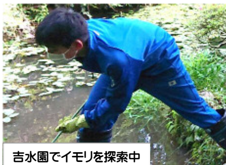
吉水園でイモリを探索中