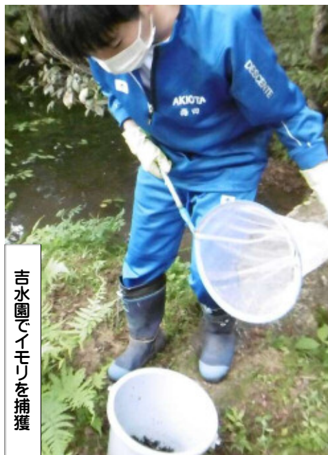
吉水園でイモリを捕獲