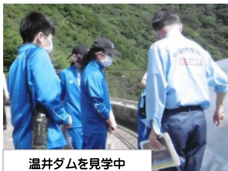
温井ダムを見学中

吉水園も温井ダムも加計地域にある施設ですが, 広い視野でふるさと安芸太田を感じることができました。