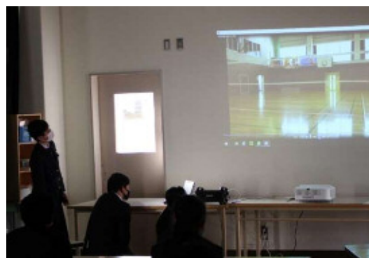
生徒会メンバーによる説明