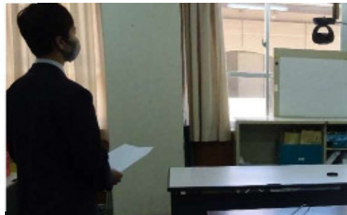
全校朝会での発表は協調学習ルームから