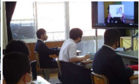
全校朝会での学級の様子