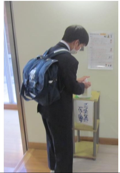
登校時に進んで手を消毒する生徒

学級では、互いの発表を真剣に聞くとともに、明るく発表する生徒の姿が見られました。どの学年の生徒も元気な姿が見られ、安心しました。