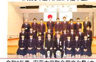
令和2年度 安芸太田町合同文化祭 (中止)