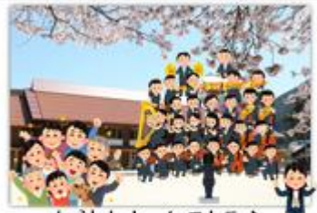
加計小オーケストラ♪ 大人も子どももまるごと「ハッピーな1年」にしよう!

加計小学校の目標は「気づいて考えてやってみる!—自分を大切に 人を大切に 力を合わせて—」です。始業式のときに、今年はみんなで楽しい音楽(活動)を奏で周りの人を幸せにする「加計小オーケストラ」になろうとお話しました。1学期が終わりますので、そのことにそって振り返りをしていきたいと思います。