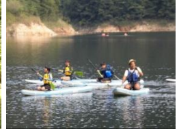
カヤック・サップ

学校では、 地域に出かけ、地域の人や産業と触れ合ったりして、地域の良さを発見したり体感したりするよう に取り組んでいます。 子供たちが「 安芸太田町で育ってよかった、筒賀小で学んでよかった。 」と言えること は、大切なアイデンティティの確立にかかわることであり、生涯にわたって地域・社会に貢献する人材の育成を 願う、本町の教育大綱の柱となるところです。子供たちが、今日の発見や感想を、おうちでも話してくれるよう 願っています。